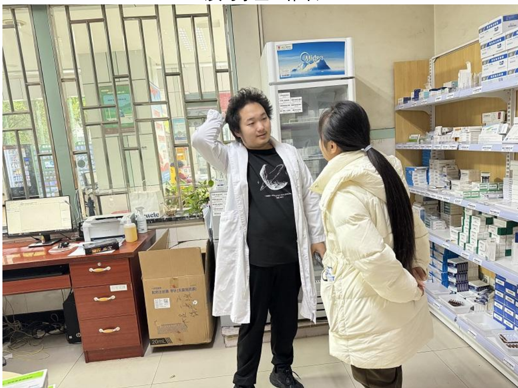
(与学院教师交流谈心 1)