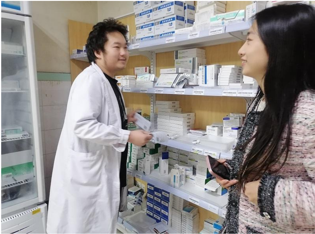
(与学院教师交流谈心 2)